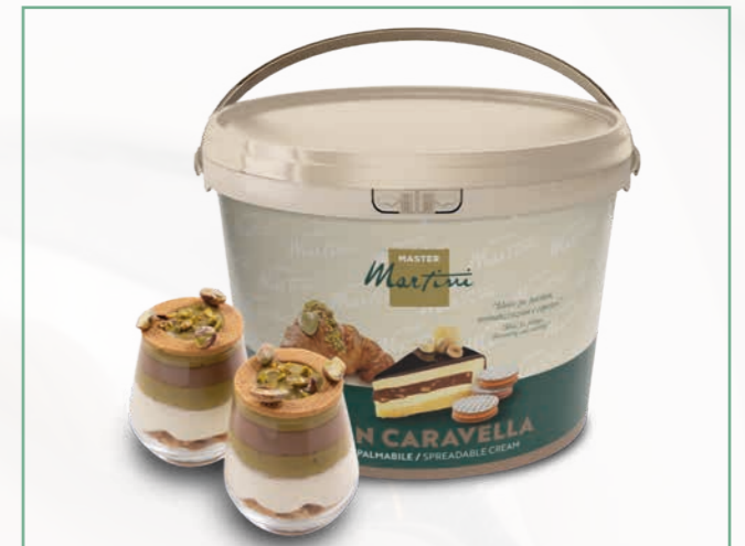
CARAVELLA CRUNCH PISTACCHIO 5 KG EIMER