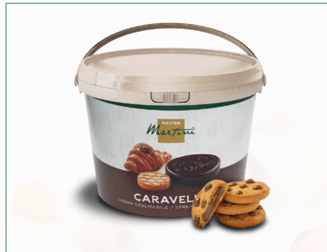
CARAVELLA HASELNUSS FOUR 13 KG EIMER