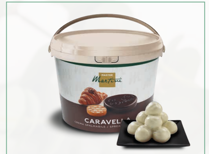
CARAVELLA WHITE CREAM 13 KG EIMER