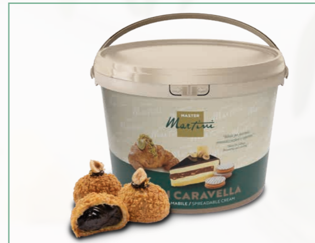
CARAVELLA GRAN MORA 13 KG EIMER