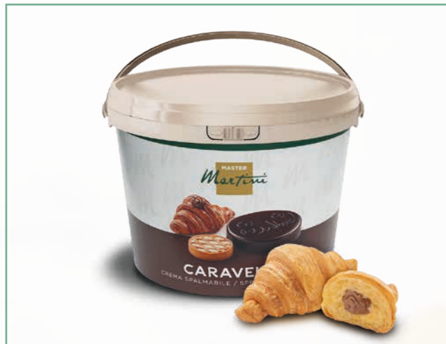
CARAVELLA HASELNUSS ANTEFORNO 13 KG EIMER