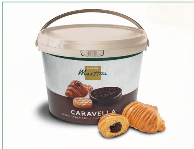
CARAVELLA ANTE-FORNO KAKAO 13 KG EIMER