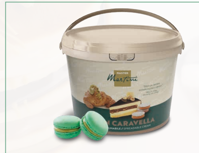
CARAVELLA GRAN PISTACCHIO 5 KG EIMER