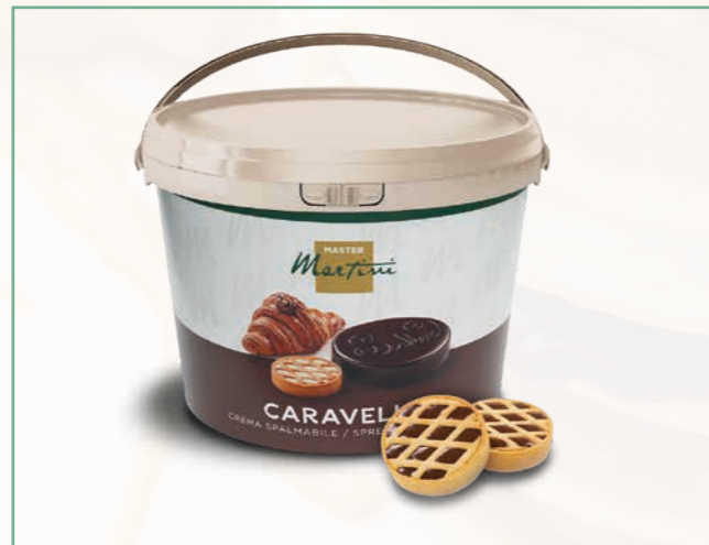
CARAVELLA FLUIFOUR KAKAO 13 KG EIMER